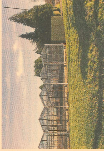
Ook serres nemen tientallen hectaren in.

Marc Van Aperen Burgemeester van Hoogstraten