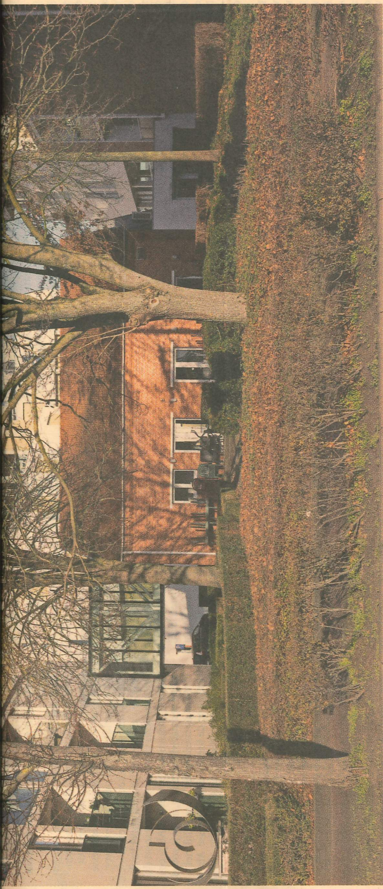
In Hoogstraten wordt wekelijks meer dan een halve hectare - een voetbalveld - open ruimte ingenomen.

landen en akkers zover je kan zien. Naarmate je het centrum nadert, schieten in het hinterland serres als champignons uit de grond. Even later zie je aan je rechterkant een bedrijventerrein, waar een groot deel van de grond braakligt en hijskranen verklappen dat er volop gebouwd wordt. Vlak voor het centrum van dit door-deweekse stadje ligt er nog een werv waar een projectontwikkelaar grote blokken bouwt. In de stad knoelt het van de auto's, de drukke gewestweg snijdt het centrum netjes in twee.