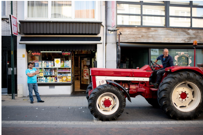
<p>Heden en verleden ontmoeten elkaar in Liedekerke.</p>

Heden en verleden ontmoeten elkaar in Liedekerke.